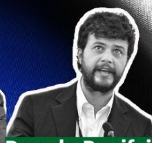
Brando Benifei Presidente Gruppo Spinelli Parlamento Europeo