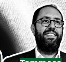
Tommaso Nannicini Senato della Repubblica Intergruppo Federalista